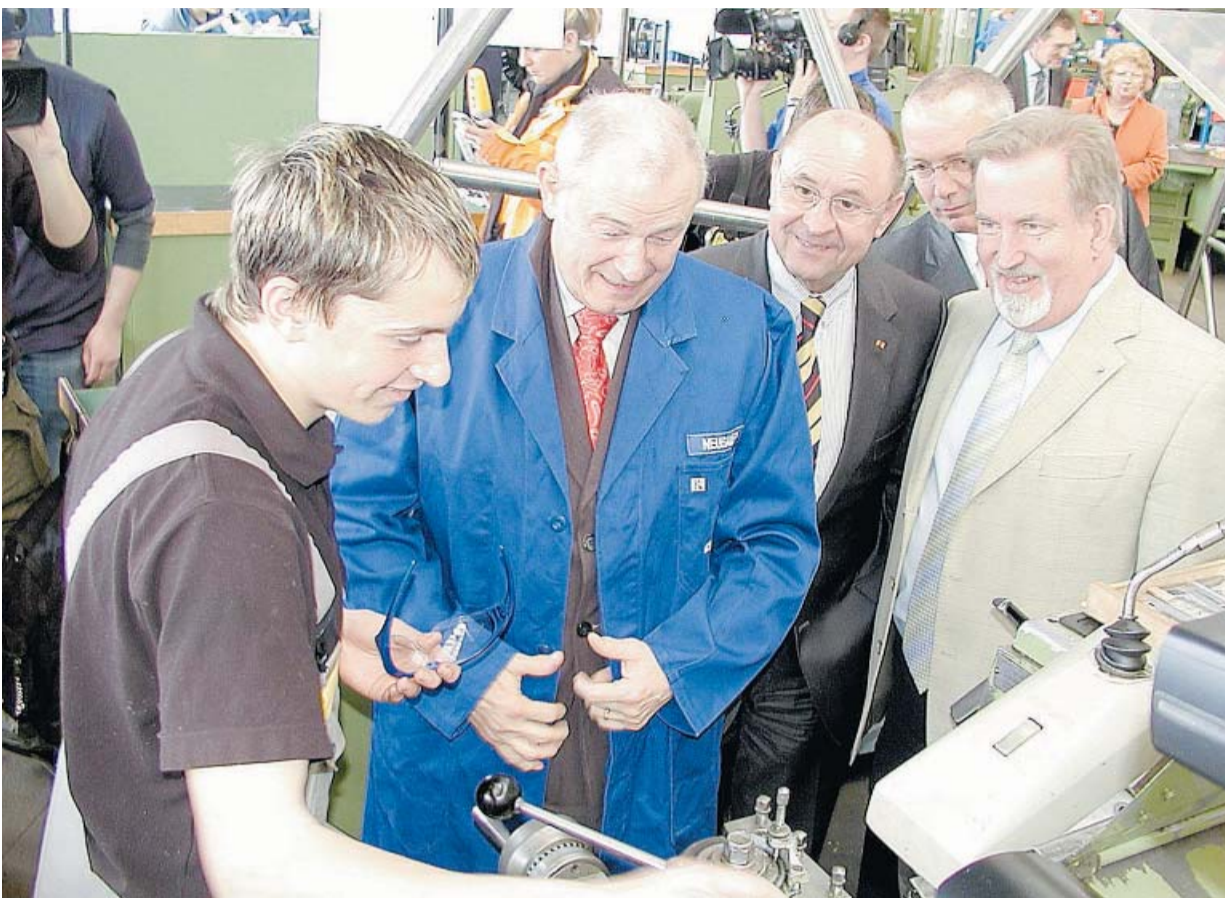
Ministerpräsident Günther Beckstein hüllte sich bei seinem Besuch in der Lehrwerkstatt der KSB in Pegnitz sogar in einen blauen Arbeitsmantel.

Ministerpräsident von Millioneninvestitionen am Standort Pegnitz beeindruckt – Vorzügliche Ausbildung